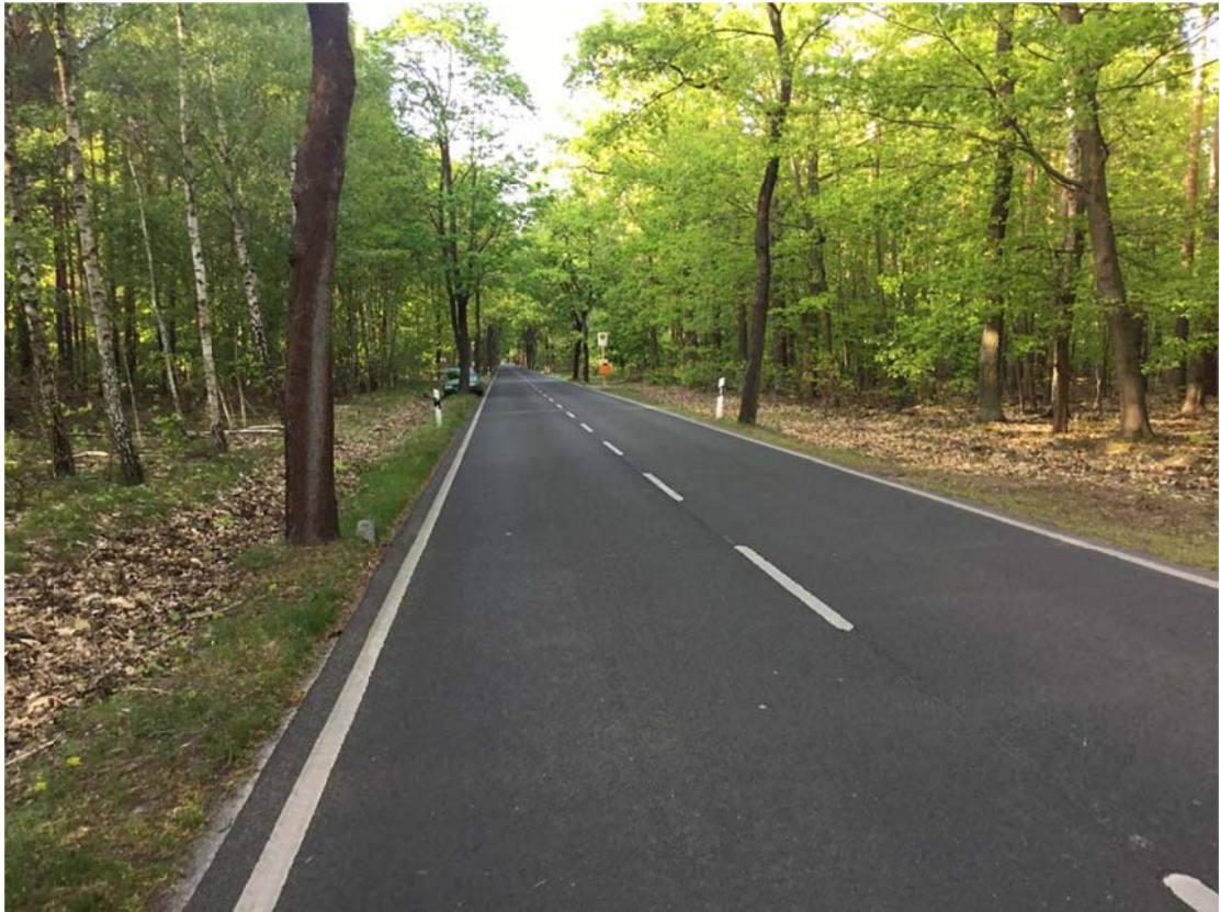
Foto der Wende bei 3 km/7km