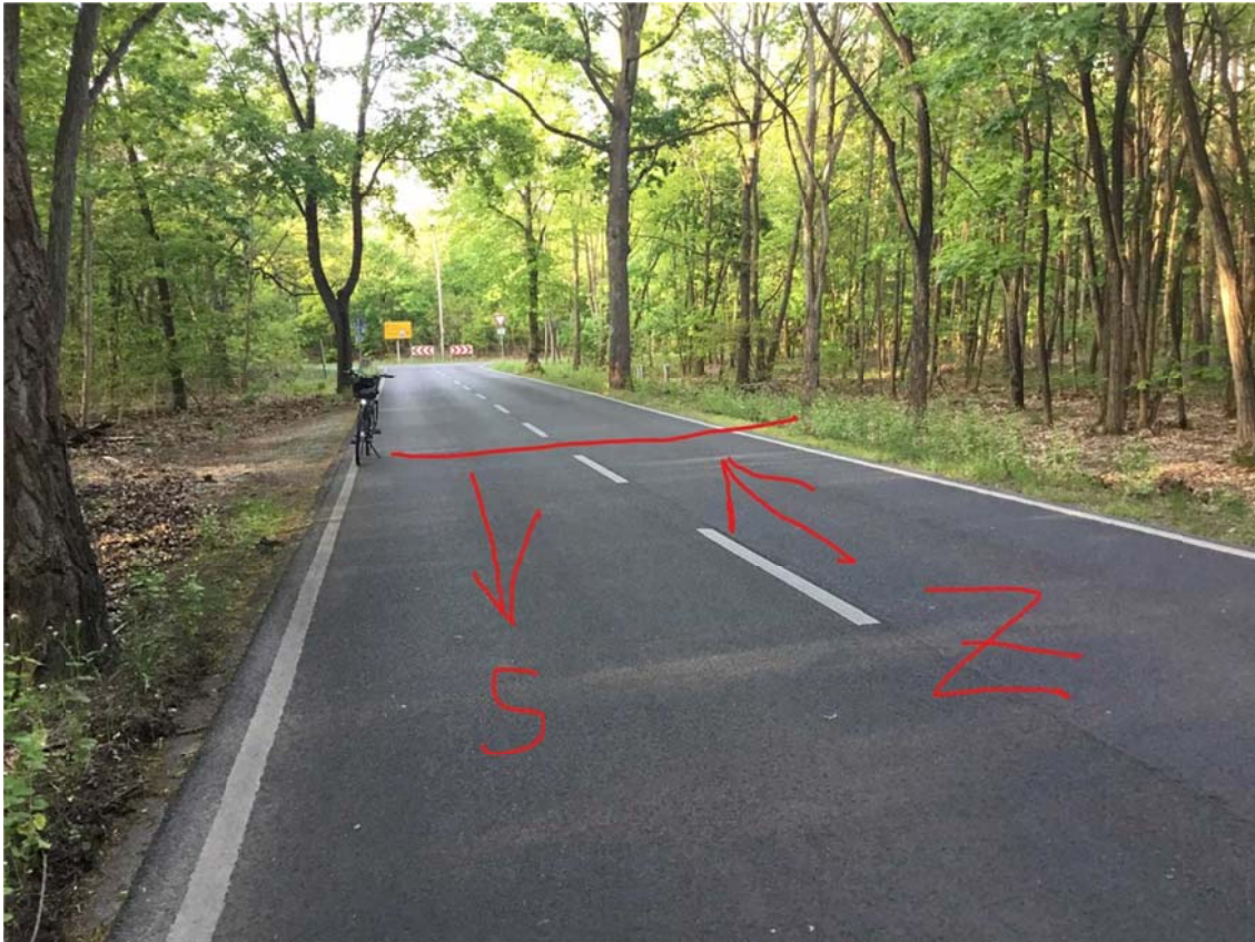
Foto Start-Ziel-Bereich mit Blick in Startrichtung